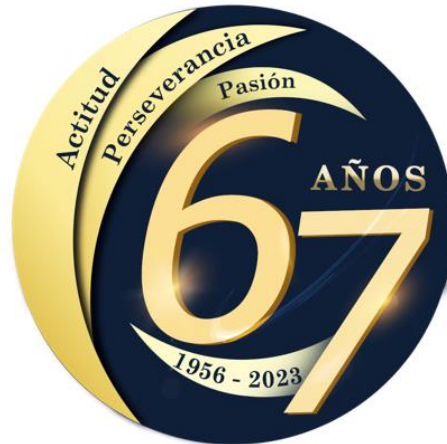
Logo 67 aniversario en png