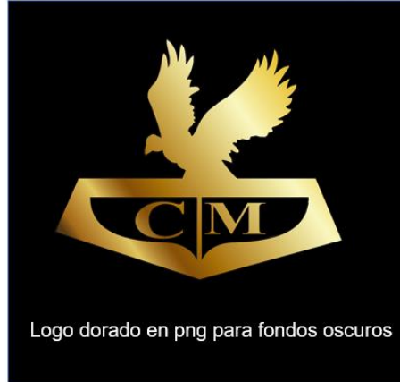
Logo dorado en png para fondos oscuros